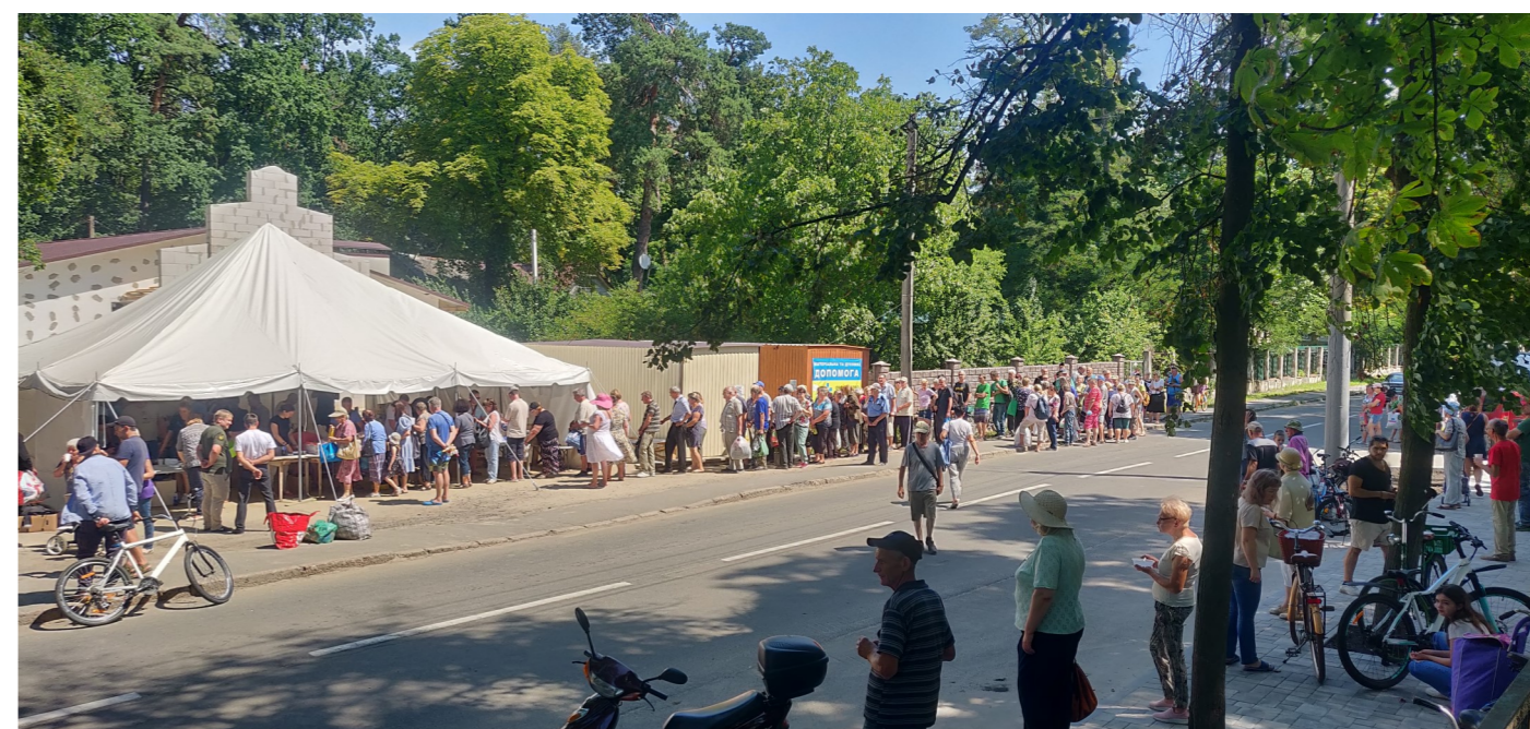
Mat utdelning till behövande i Butja.