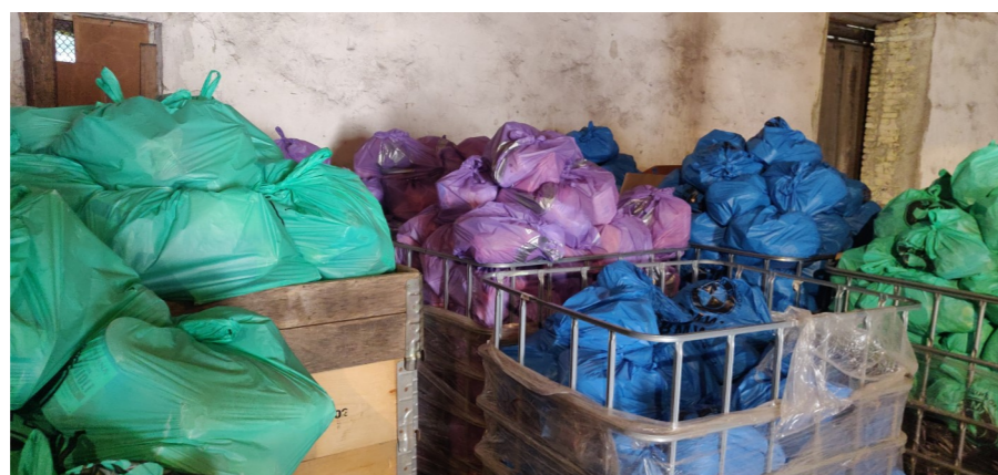
Matpaketet sorteras i färger utifrån vilken åldersgrupp de delas ut till.

Vi fick beskrivet för oss om de första månaderna av kriget, när människor kom flyende i en till synes aldrig sinande ström, och om hur hjälpen från Sverige gav människor mat och en värdig sängplats. Man berättade om hur osäkert och oklart allting var. Hur hjälpen pågick mer eller mindre dygnet alla timmar.